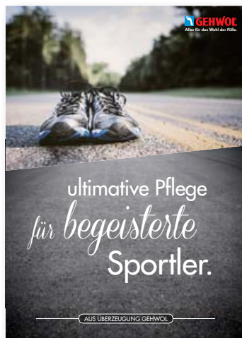
Sportler Bestell-Nr. 720 211 400