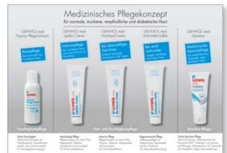
Beratungskarte med Pflegekonzept Bestell-Nr. 720 050 110 Preis 0,55 EUR