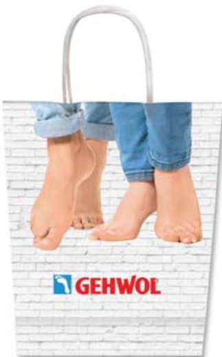
GEHWOL Tragetasche Papier Bestell-Nr. 720 071 009 Preis 3,10 EUR/ 30 Stück