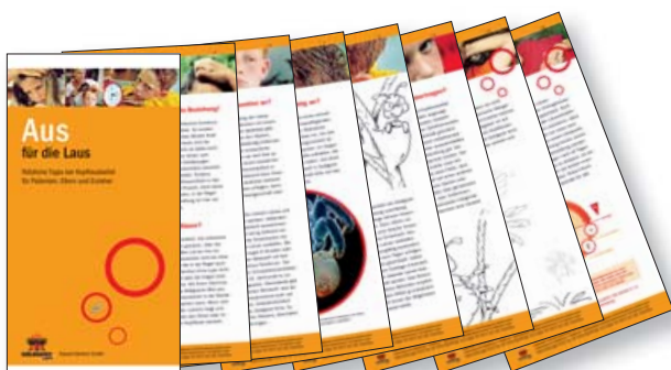
GOLDGEIST Infobroschüre Bestell-Nr. 720 661 540 Preis 2,56 EUR/ 10 Stück