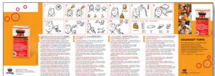
GOLDGEIST Multilingualer Flyer - Anwendung enthält folgende Sprachen: Deutsch, Englisch, Türkisch, Serbisch, Polnisch, Russisch, Arabisch und Persisch (Dari) Bestell-Nr. 720 480 800 Preis 1,29 EUR/ 10 Stück