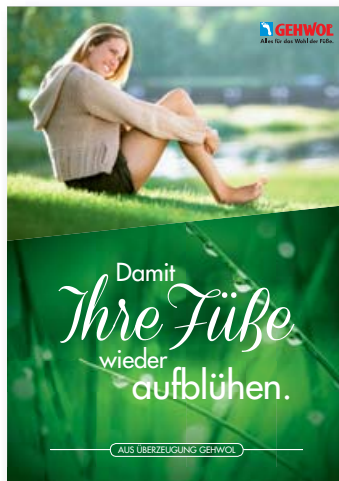
Frühling Bestell-Nr. 720 261 900