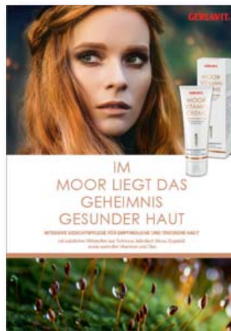
Moor Vitamin Creme Bestell-Nr. 720 241 801