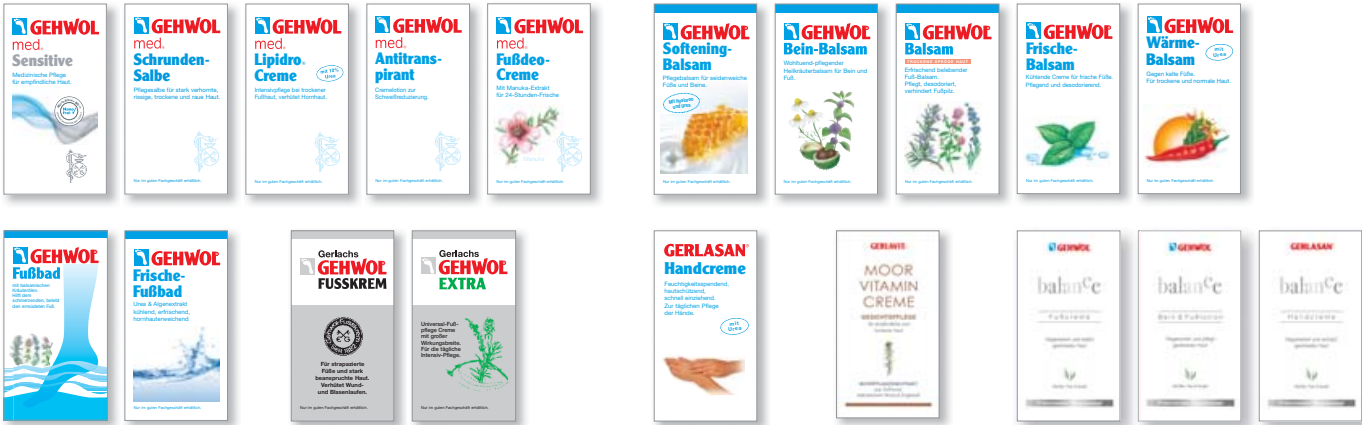
GEHWOL Produktproben Preis 0,15 EUR/ pro Stück