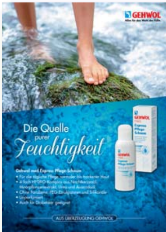
GEHWOL med Express Pflege-Schaum Bestell-Nr. 720 243 860