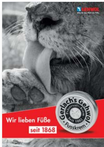
Image Löwe Bestell-Nr. 720 211 150