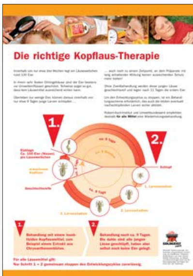
GOLDGEIST Poster Kopflaus-Therapie Bestell-Nr. 720 200 101 Preis 2,64 EUR

GOLDGEIST Handzettel sind in folgenden Sprachen erhältlich: Englisch, Russisch, Polnisch, Serbisch, Türkisch, Persisch (Dari), Arabisch und Deutsch Bestell-Nr. 720 400 000 (ff) Preis 0,22 EUR/ 10 Stück