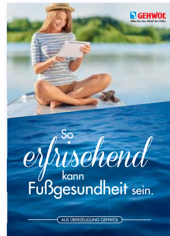
Sommer Bestell-Nr. 720 262 000