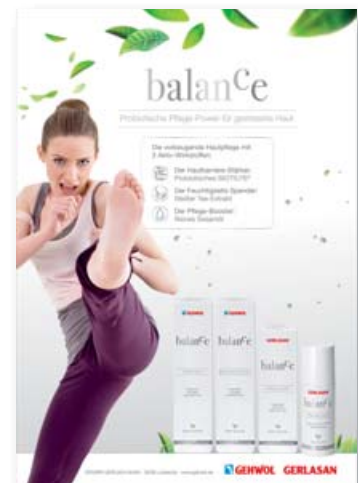
balance Bestell-Nr. 720 243 870