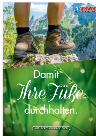
Wandern Bestell-Nr. 720 211 420