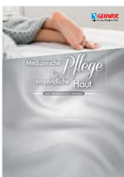
GEHWOL med Sensitive