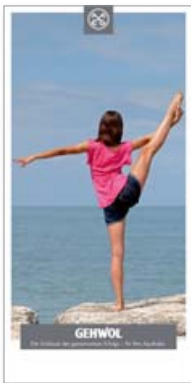
GEHWOL Verbraucherinfos Bestell-Nr. 720 410 000 Preis 1,09 EUR/10 Stück

Informationsmaterialien für Ihre Kunden.