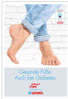
GEHWOL Diabetesratgeber Bestell-Nr. 720 662 603 Preis 1,73 EUR/10 Stück