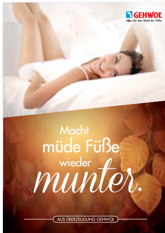
Herbst Bestell-Nr. 720 262 300