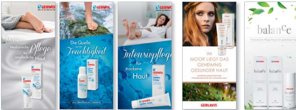
GEHWOL, GERLAVIT und balance Produktinfos Preis 0,55 EUR/ 10 Stück